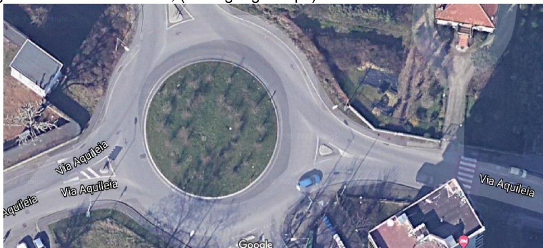
Immagine aerea della rotatoria

La tipologia di valorizzazione dell'area verde consigliata per la sponsorizzazione della rotatoria è la piantumazione di essenze arboree che necessitino di scarsa irrigazione, manto erboso, formazione di aiuole fiorite e/o la posa di pietrisco su telo pacciamante onde evitare la formazione di crescita di erbe infestanti.